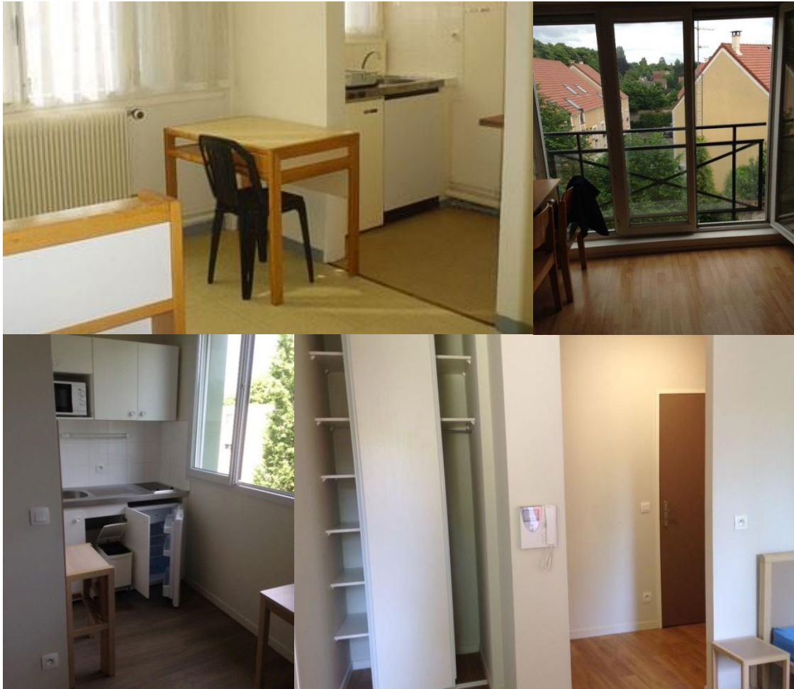
Exemples de logements proposés

La location meublée doit porter sur un logement muni de tout le mobilier nécessaire à l'habitation. Cette modalité de location est encadrée par la loi Alur de mars 2014. Ces logements permettent à de jeunes actifs âgés de 18 à 30 ans (voire au-delà) de louer des studios et des T2 meublés en région parisienne. Le montant mensuel des loyers s'élève de 450 à 600 € toutes charges comprises (eau, chauffage, ...).